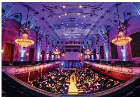
© MCG Krug Gross © MCG Krug Klein