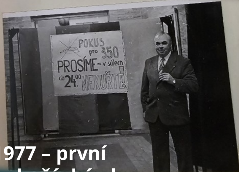
1977 – první nekuřácký ples

PŘEDPRODEJ VSTUPENEK V ZK-ČSD - VSTUPNÉ 10 KčS + 1 KčS PÍSTENKA PŘEDVÝKONÍ PROVEDE SKUPINA SPOL. TANCE PŘI OSV. DOMĚ V ÚSTÍ NAD M.