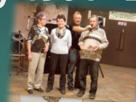
Silvestra vespero 2014.