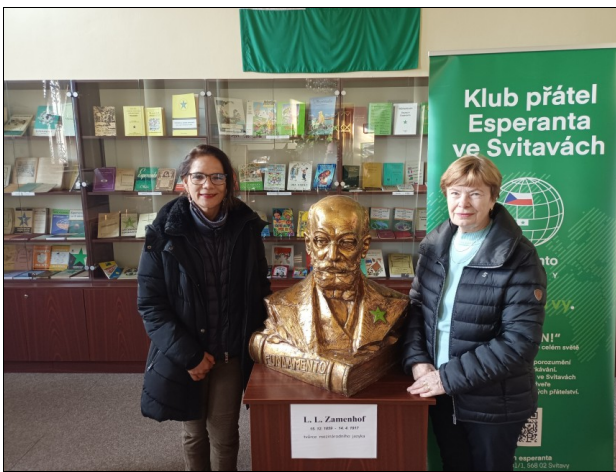
Meksika gastino Xochitl Yin en nia muzeo