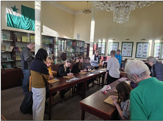
Marcipana Kristnasko en nia muzeo