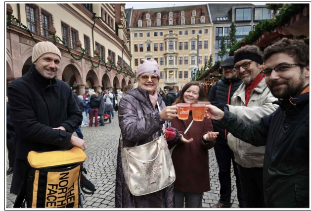
Antaŭkristnaska kolbasumado en Lepsiko