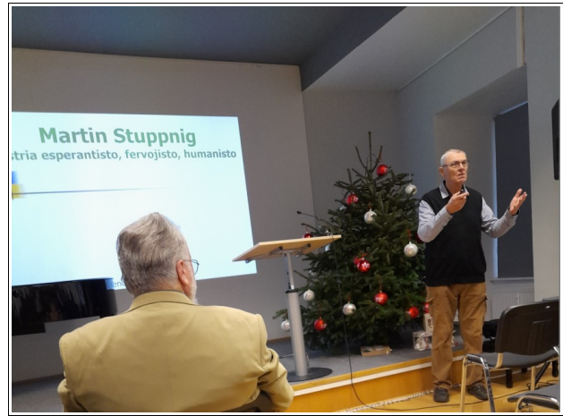
Zamenhof-tago en Vieno