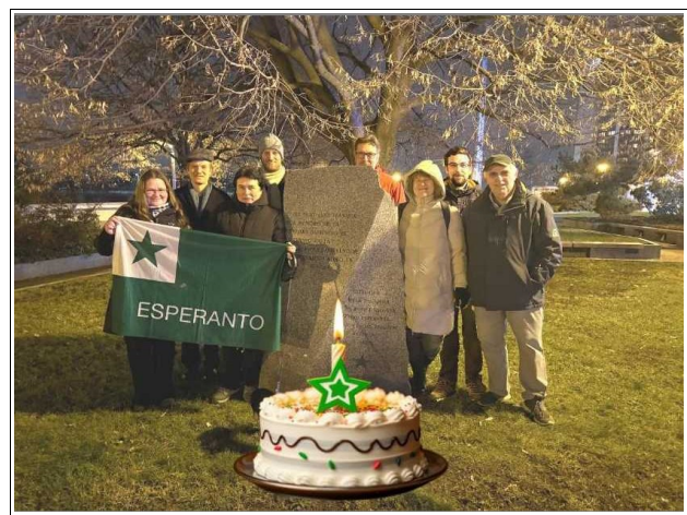
Zamenhof-festo en Prago