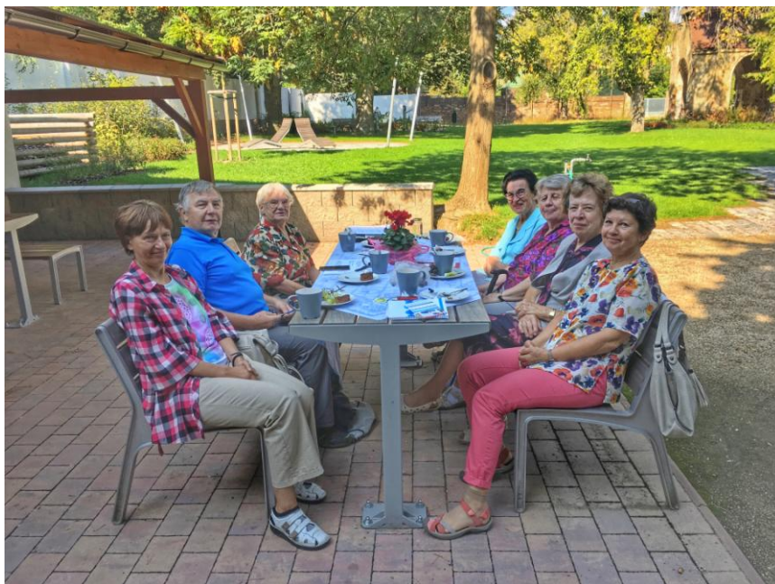
Začínáme v Klementince (2018).