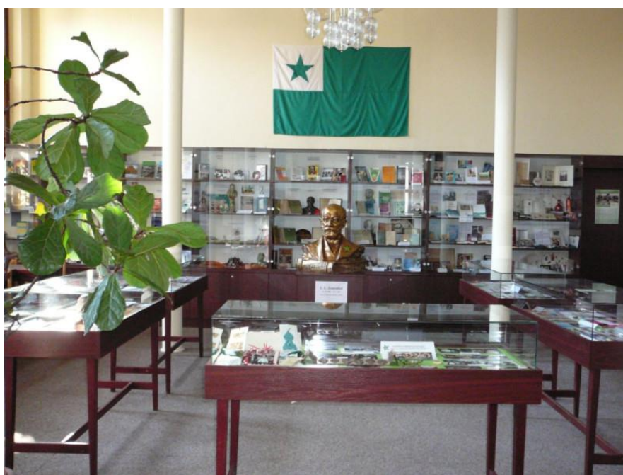
Esperanto-Muzeo post la rekonstrulaboroj