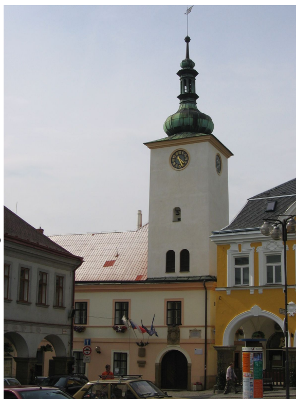
Urbdomo en Ústí nad Orlicí (aŭtoro Radek Bartoš)

Detalaj aktualaj informoj troviĝas en la „KALENDARO DE ARANĜOJ“ .