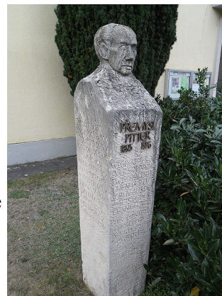
Busto de Přemysl Pittra en Norimberko