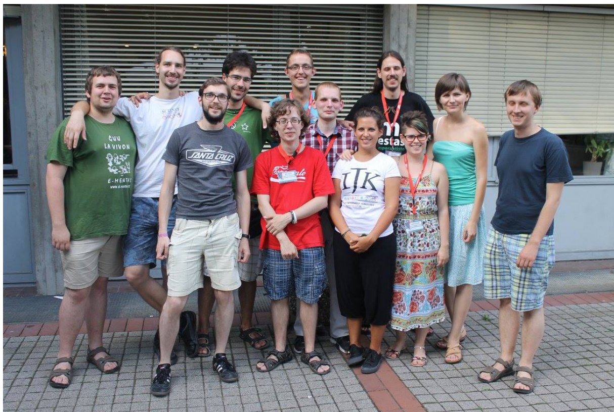
Komuna foto de partoprenantoj de la 71-a IJK en Wiesbaden, kiuj parolas la ĉeĥan aŭ slovakian lingvon

Tutmonde https://creativecommons.org/licenses/by/4.0/deed.eu