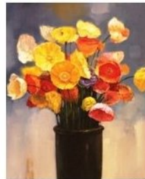
Ho-Song, Jižní Korea