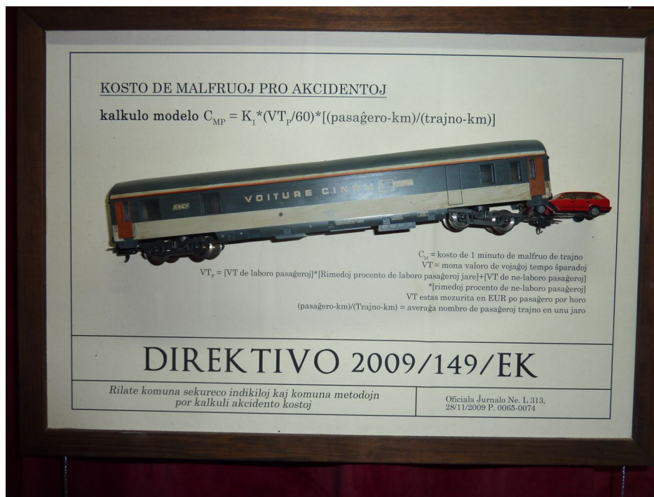
Ekzemplo de direktivo prezentata en la ekspozicio

Intervjuon kun la aŭtoro vi povas legi ĉi tie .