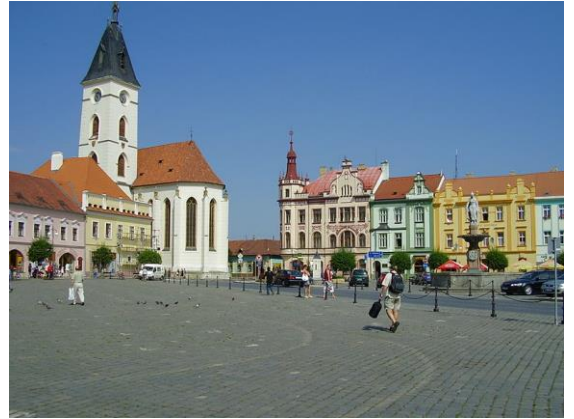
Centro de Vodňany

La 7-A POSTFERIA RENKONTIĜO EN SUDA BOHEMIO okazos la 7-an de septembro, ĉi-foje en Vodňany kadre de la Urba Solenaĵo de Vaporo. Alveno de la vaportrajno, historia pro cesio, kultura programo surplace, trarigardo de la urbocentro (kun Esperanto-ĉiĉeronado), komuna tagmanĝo kun lingvokleriga programeto, vizito de la Urba Muzeo kaj Galerio, Esperanto-konversacio en sukeraĵejo aŭ dumpromene preter la fiŝlagoj. Kotizo por tagmanĝo (ĉefplado, eblas ankaŭ senvianda) + organizaj elspezoj 80,- CZK (pensiuloj, studentoj, senlaboruloj) aŭ 100,- CZK (laboruloj) pagotas surloke. Partopreno en la programo senpagas. Aliĝkontakto: pisek@esperanto.cz . Renkontiĝo inter 9:00 kaj 9:15, preciza loko estos konfirmata al la aliĝintoj. Por havi garantion pri tagmanĝo, bv. anonci vin ĝis 4.9.!