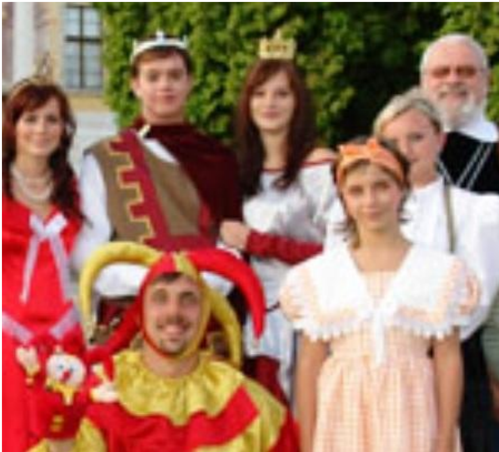
Pyšná princezna - Fiera reĝidino (2008)