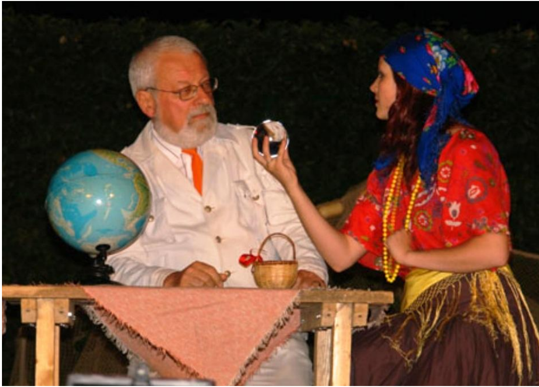
Jankovec - Děvče z přístavu - Junulino el la haveno (2010)