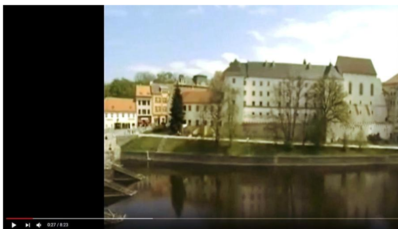
Královské město Písek - v esperantském dabingu

Kun direktorino de la Urba Muzeo en Netolice kaj la vicurbestro dum inaŭguro de la migra ekspozicio "Ĉu Esperanto estas morta lingvo?" kaj "60 jaroj de Esperanto en Netolice" - kadre de la aranĝo organizita kunlabore kun la klubo La Ponto Písek