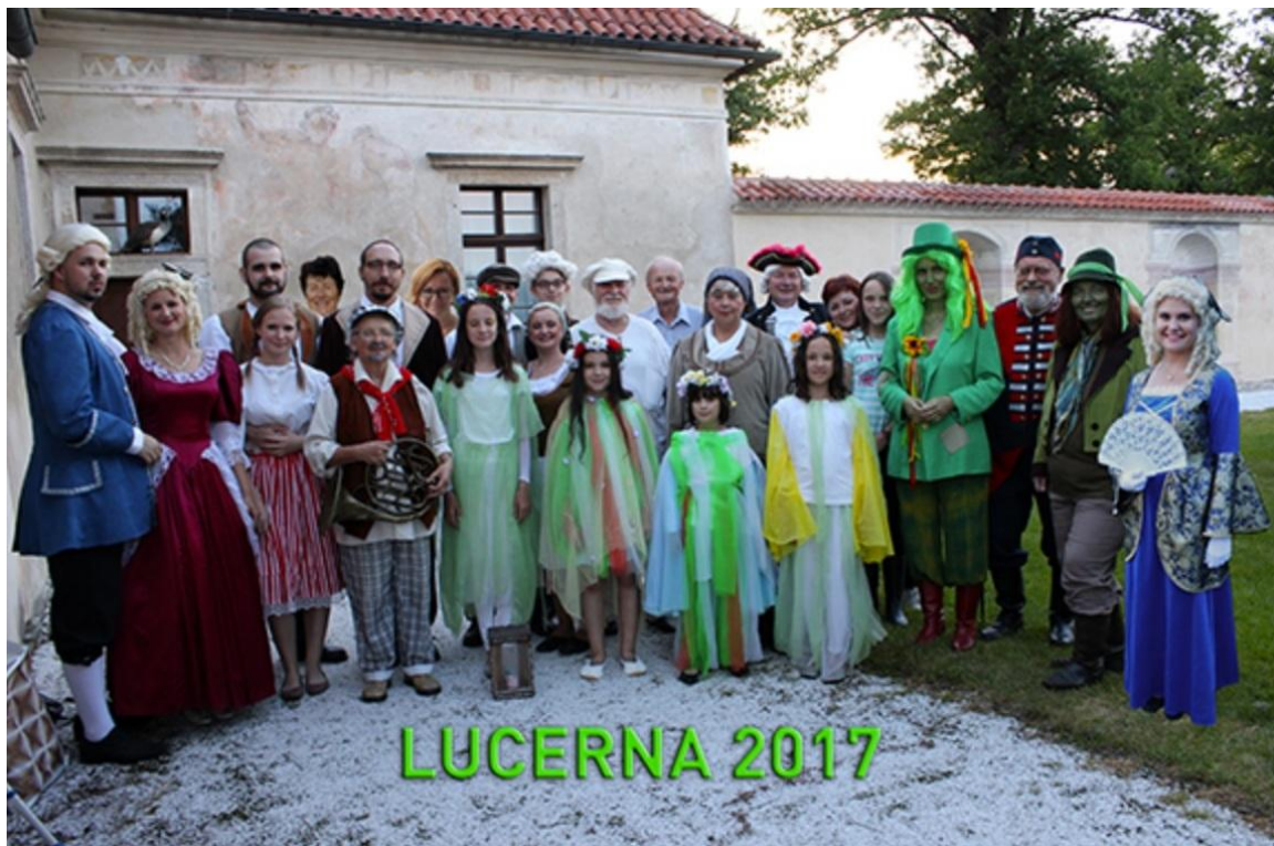
Jirásek - Lucerna - Lanterno (2017)