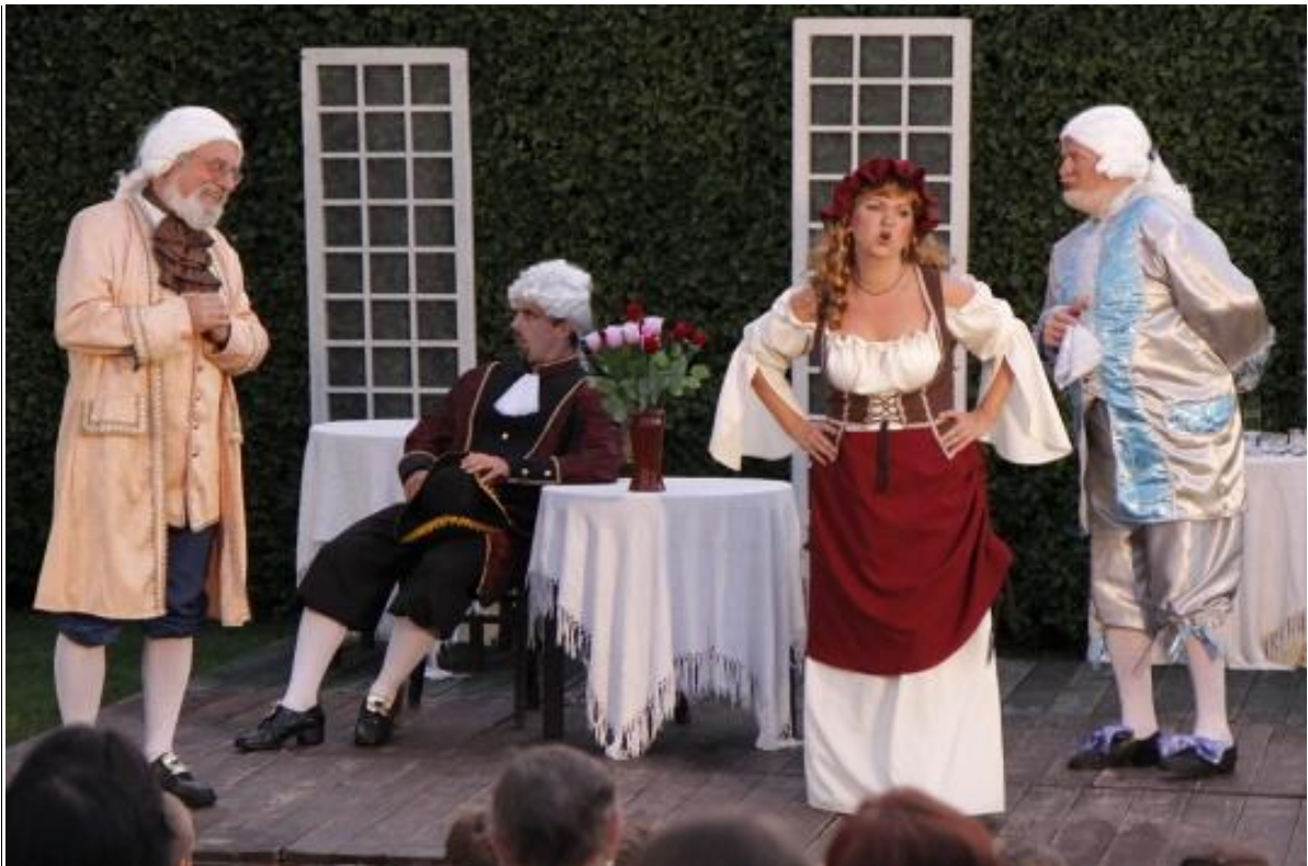
Goldoni - Mirandolina (2012)