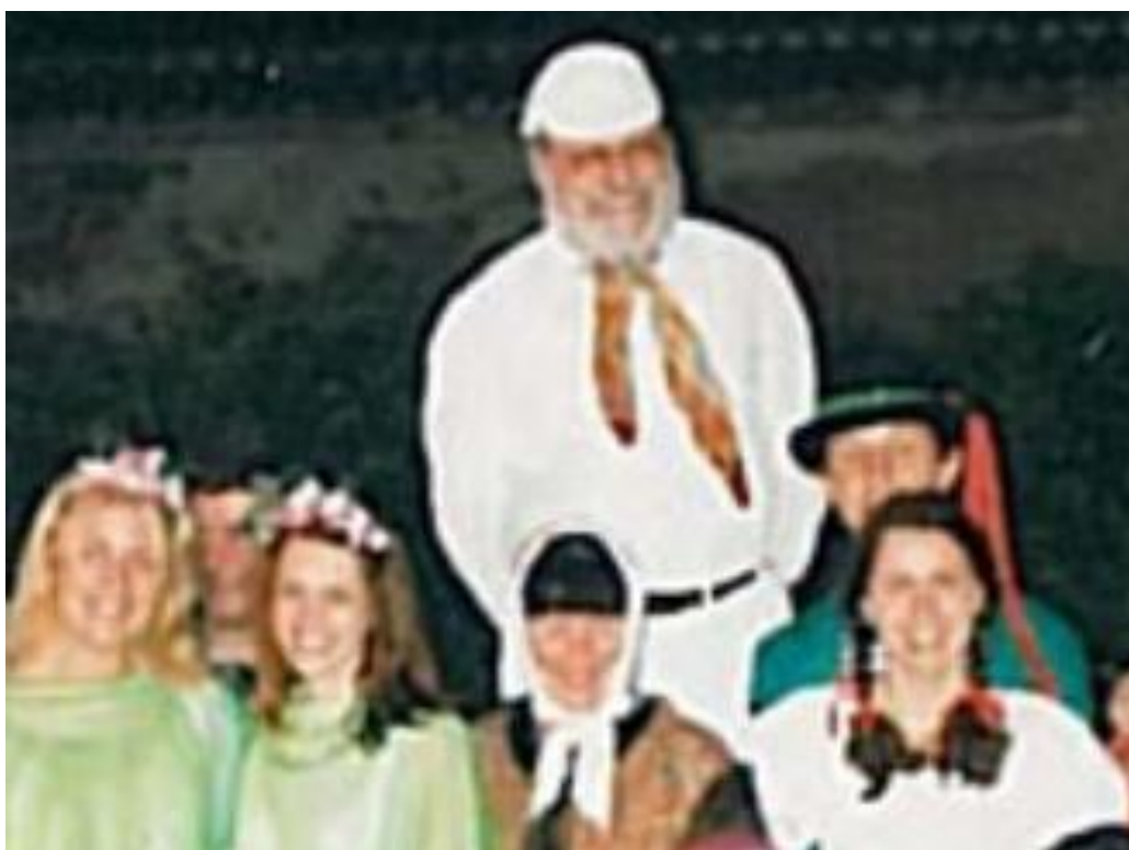
O zakletém mlynáři - Pri la ensorcîta muelisto (1997)