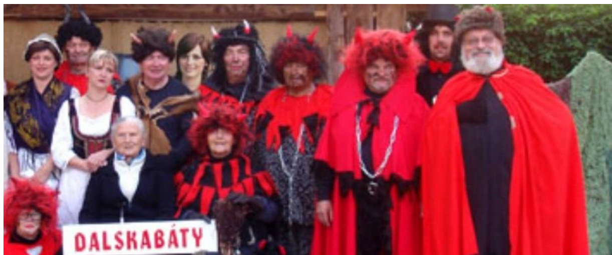
Drda - Dalskabáty, hříšná ves Dalskabáty, pekoplana vilaĝo (2009)