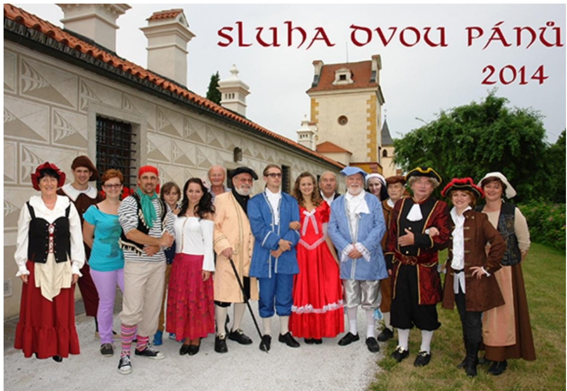
Goldoni - Sluha dvou pánů - Servisto de du mastroj (2014)