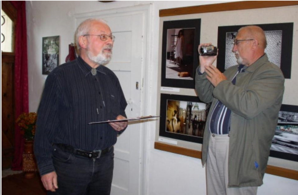
Vystoupení na vernisáži v Muzeu JUDr. Kudrny Netolice (2010) Prezentiĝo dum la kultura programo de la inaŭguro de la ekspozicio en la Urba Muzeo de d-ro Kudrna en Netolice (2010)