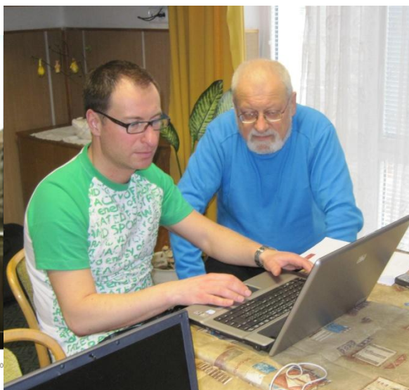
Další v pořadí