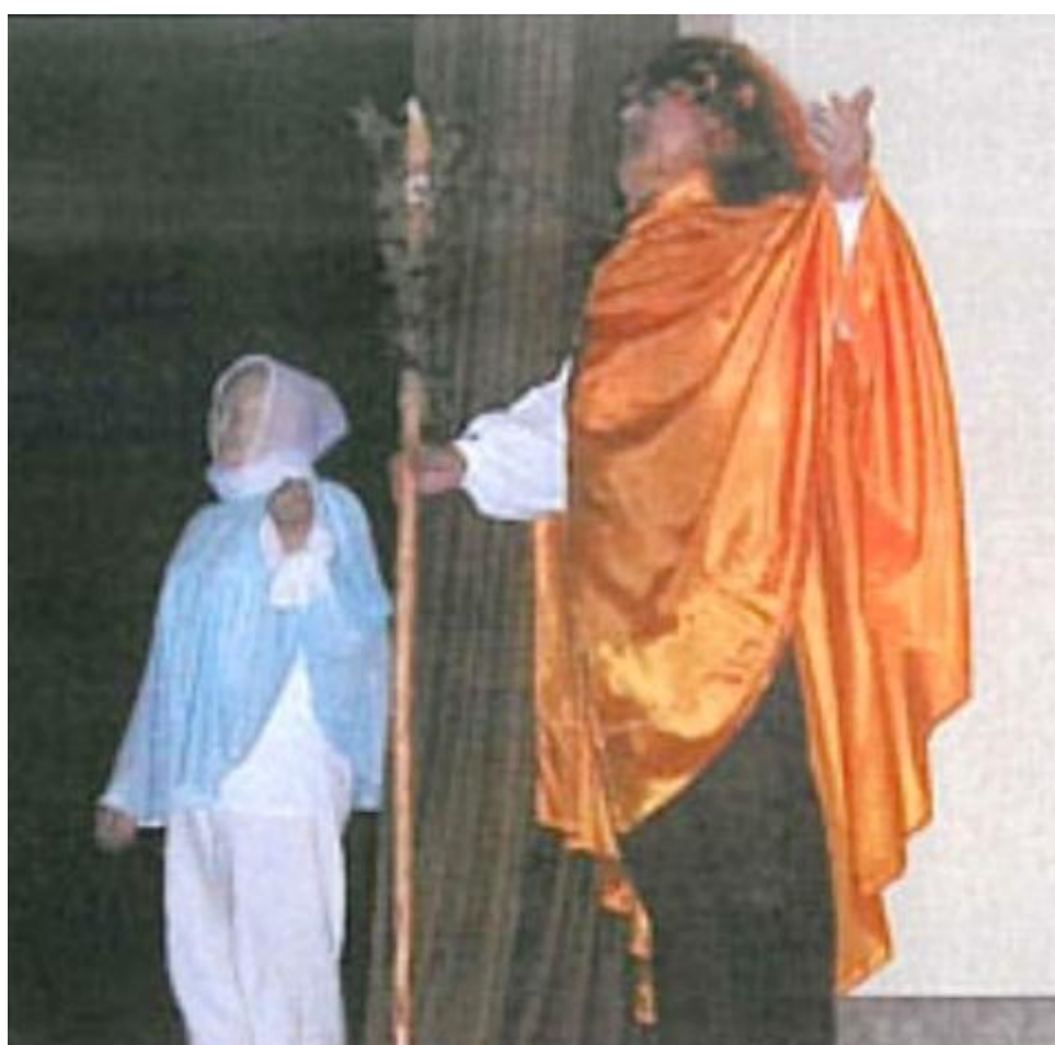
J.K.Tyl - Tvrdohlavá žena - Durkapa virino (2000)