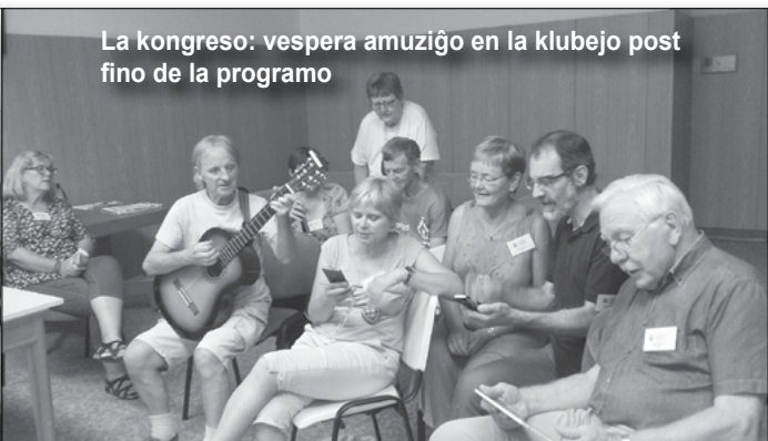
La kongreso: vespera amuziĝo en la klubejo post fino de la programo

*) Populara aro da kvin gimnastikaj rutinaĵoj, kiuj devus havi sanigan efikon kaj al la korpo kaj al la spirito de la homo.